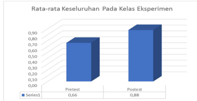
"Gambar diagram hasil perbandingan kelas Eksperimen pretest-posttest"

test yang digunakan dalam ujicoba ini reliabel sehingga dapat digunakan sebagai instrument penelitian.