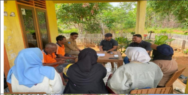
Gambar 2. Sosialisasi dengan Kepala Kampung dan Sekretaris Kampung