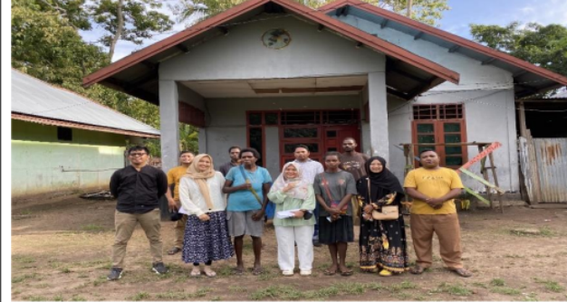
Gambar 3. Sosialisasi dengan ketua adat