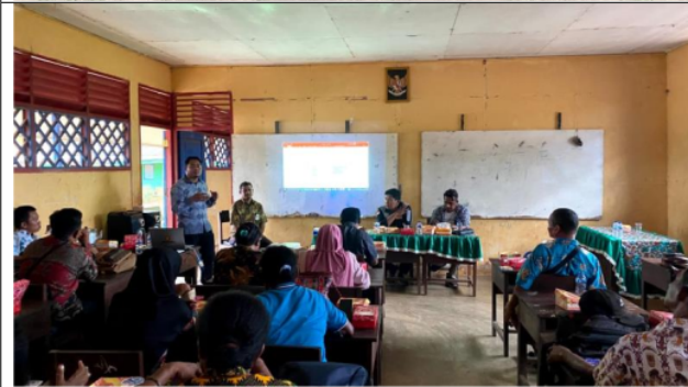
Gambar 4. Sosialisasi kepada masyarakat Kampung Baidub