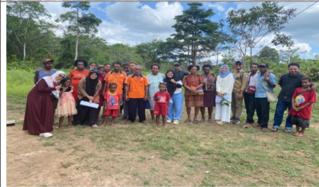
Gambar 5. Foto bersama setelah sosialisasi